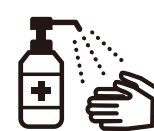
手指消毒用アルコール による消毒の励行

新型コロナワクチンの有効性・安全性などの詳しい情報については、厚生労働省ホームページの「新型コロナワクチンについて」のページをご覧ください。