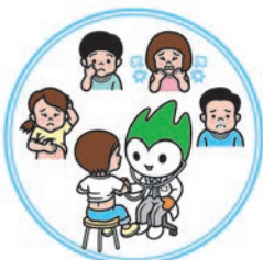
山口アレルギードクターのマーク