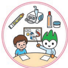
山口アレルギーサポートスタッフのマーク